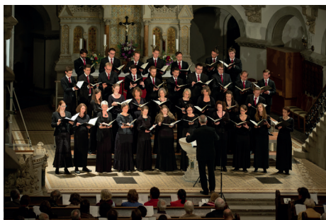
Vocal Concert Dresden

Die Reihe Lied in Dresden findet nach der erfreulichen Besucherresonanz des letzten Studienjahres auch in den kommenden Semestern eine Fortsetzung. Dabei wird der Konzertsaal der Hochschule für Musik sozusagen zur Heimstätte dieser traditionellen