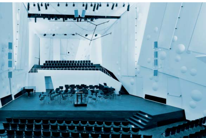
Konzertsaal der HfM Dresden