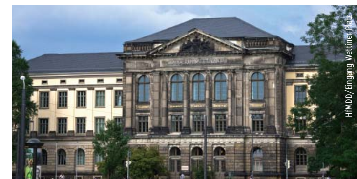
HfMDD/Eingang Wetlimer Platz

ab 15:15 Workshops/Führung durch das IMM Leubnitzer Straße 17b Vorstandssitzung DGfMM Seminarraum IMM